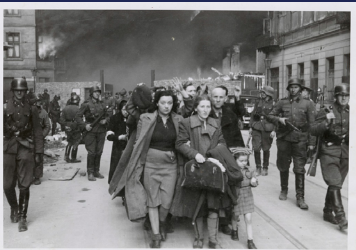
Zdjęcie 6. Ludność cywilna opuszczająca płonące getto.