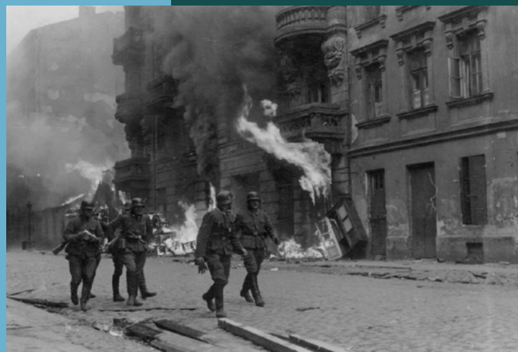
Zdjęcie 4. Żołnierze niemieccy podczas pacyfikacji powstania w getcie warszawskim.