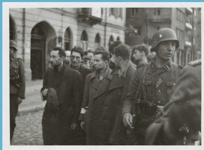
Zdjęcie 5. Powstańcy w getcie warszawskim.