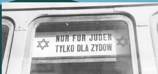
Zdjęcie 1. Tramwaj z warszawskiego getta przeznaczony tylko dla Żydów.

**Gazety wydawane przez niemieckie władze okupacyjne. Publikowane w nich materiały miały charakter propagandowy i antysemicki. „Warschauer Zeitung” wydawana była po niemiecku, a „Nowy Kurier Warszawski” ukazywał się po polsku.